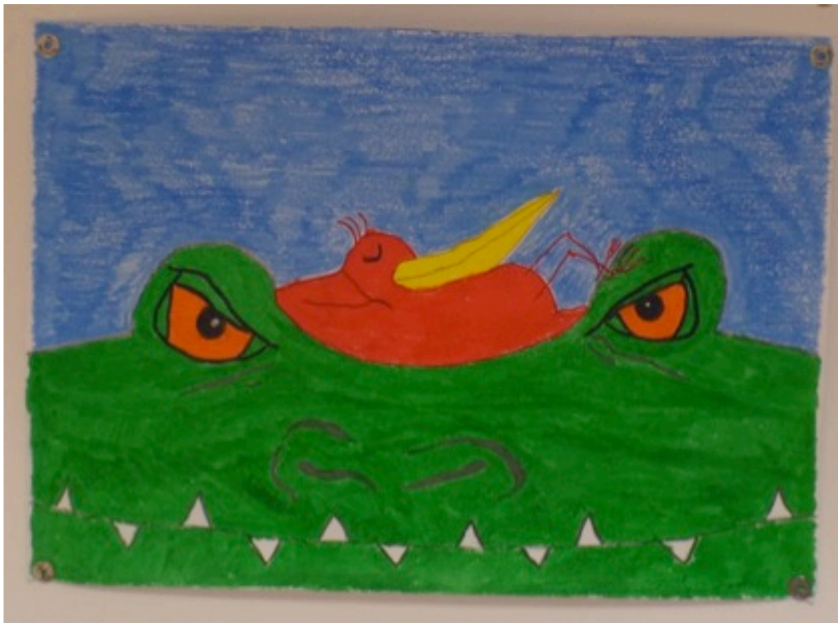
Andrea disegna Cesare di Solotareff (Babalibri).